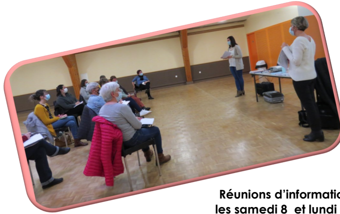
Réunions d'informations collectives les samedi 8 et lundi 10 janvier 2022

Relais Petite Enfance / Relais Assistants Maternels