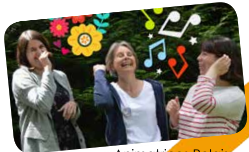
Animatrices Relais Petite Enfance