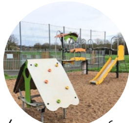
Le Pin en Mauges