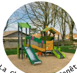
La Chapelle du Genêt