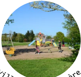
Villedieu la Blouère

Ci-joint dans ce journal, une fiche pratique de la revue l'assmat n°205.