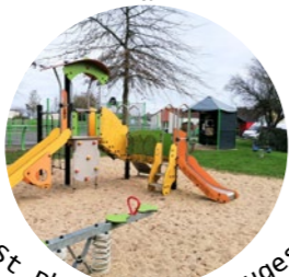
St Philbert en mauges