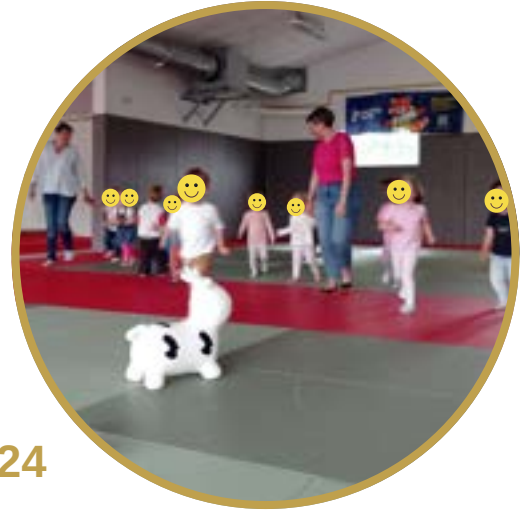
Matinées récréatives de Jallais : Mardi 10 et jeudi 12 septembre 2024

Le groupe des matinées récréatives de Jallais se retrouve deux fois par an au gymnase pour la plus grande joie des enfants. Ces 2 matinées permettent à l'enfant de se mouvoir librement dans un espace sécurisant, matelassé et coloré.