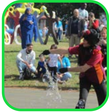
Fête des 60 ans du Centre Social : samedi 14 septembre 2024

Plus de 400 personnes se sont retrouvées samedi 14 septembre 2024 pour fêter les 60 ans du Centre social à la Chapelle du Genêt. Structures gonflables, espace petite enfance, mini golf, déambulation de bulles, escape game, spectacle musical...une richesse de propositions pour se divertir à tous les âges.