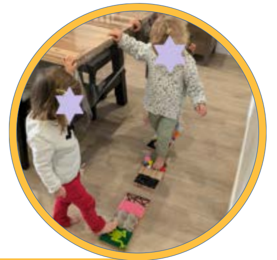
Soirée conviviale : parcours sensoriel jeudi 26 septembre 2024

Le groupe des matinées récréatives de Jallais se retrouve deux fois par an au gymnase pour la plus grande joie des enfants. Ces 2 matinées permettent à l'enfant de se mouvoir librement dans un espace sécurisant, matelassé et coloré.